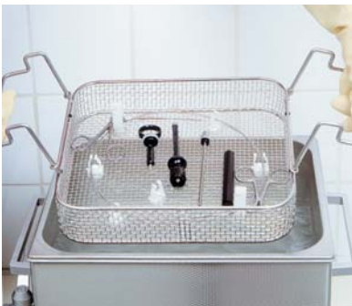
Endoskopzubehör in Fixierklammern FE 12

Aufbereitung medizinischer Instrumente im Ultraschallbad Schneller Instrumentendurchlauf und schonende Intensiv-Reinigung durch gleichzeitige Desinfektion und Reinigung in 5 Minuten. Keine Beschädigung der Instrumente durch „Bürsten“.