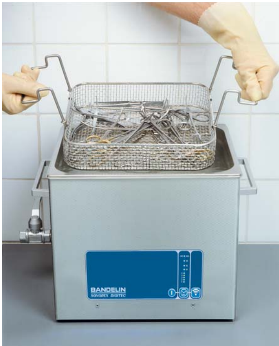
SONOREX DIGITEC DT 514 mit K 14

Aufbereitung medizinischer Instrumente im Ultraschallbad Schneller Instrumentendurchlauf und schonende Intensiv-Reinigung durch gleichzeitige Desinfektion und Reinigung in 5 Minuten. Keine Beschädigung der Instrumente durch „Bürsten“.