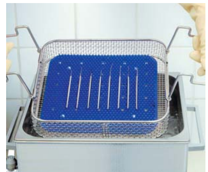
Mikro-Instrumente auf Silikon-Noppenmatte SM 14