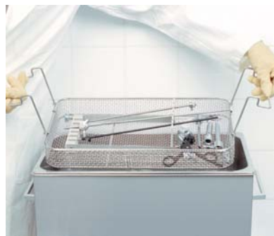
MIC-Instrumente im MIC-Halter MH 28